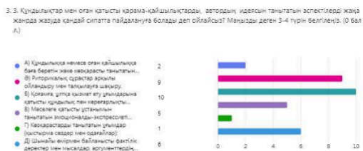
2-сурет – Оқушылардың ақпаратты өңдеу негізінде аудиторияға әсер ету амалдарын таңдау көрсеткіштері

Кесте – Нұсқаулықта қарастырылған іріктелетін тілдік бірліктер туралы мәлімет