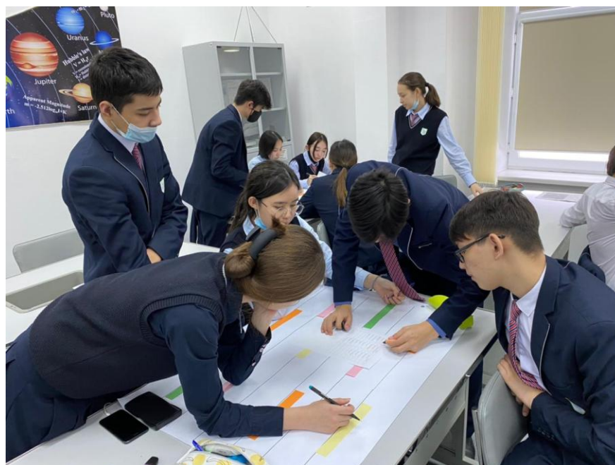
2-сурет. Оқушылар лингвостатистикалық зерттеу нәтижесінде алынған сөздерді жазылым жұмысында қолдануды ойластыруда.